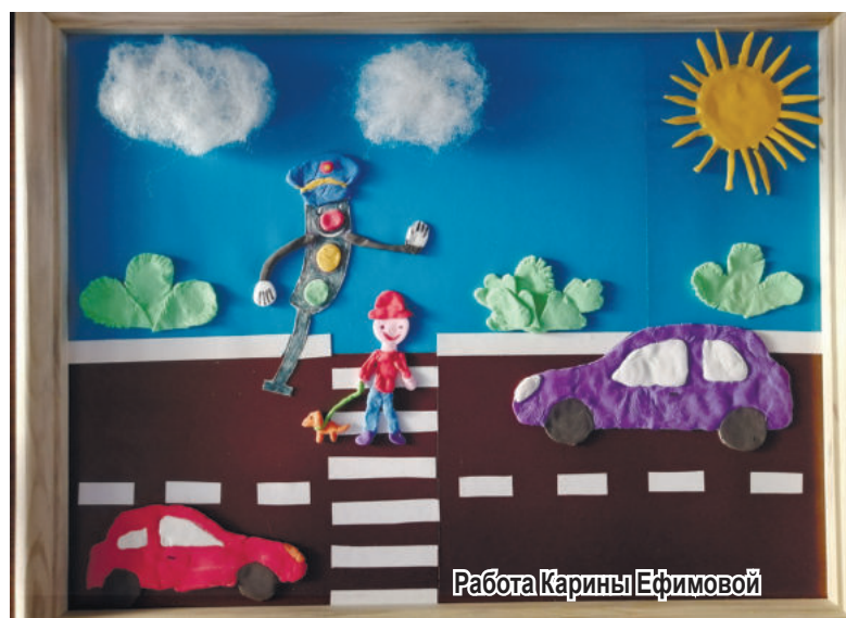
Работа Карины Ефимовой

Анна Лапина, специалист по связям с общественностью МО МВД России «Ирбитский»