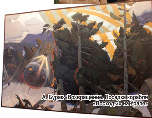
А. Бурак «Возвращение. Посадка корабля «Восход-2» на Урале»

лометров от места происшествия в тайгу доставили лесорубов, которые расчистили место для посадки спасательных вертолётов. И вот 21 марта до аппарата добрались спасатели на лыжах. И космонавты вместе с ними отправились к расчищенной вертолётной площадке. А там их посадили на вертолёт, доставили до Перми, а оттуда уже отправили на Байконур, где ждали космонавтов.