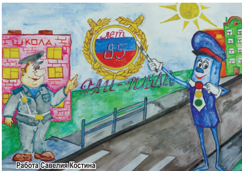
Работа Савелия Костина

Ирина Новгородова, МБУ ЦБС Ирбитского МО «Речкаловская сельская библиотека», фото автора